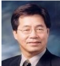
고문 정흥섭 동명대학교 총장 前 신라대 총장 前 교육혁신위원장