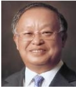
명예고문 손경식 (주) CJ회장 한국경영자총연합회회장