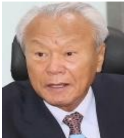
고문 박 승 중앙대 명예교수 前한국은행총재/금통위의장 前건설부장관/대통령경제수석